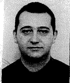
(портрет на получателя)

ЗА ВИСШЕ ОБРАЗОВАНИЕ НА ОБРАЗОВАТЕЛНО-КВАЛИФИКАЦИОННА СТЕПЕН