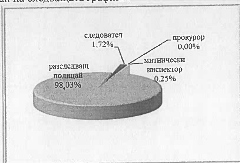
Фиг. 3. Относителен дял на новообразуваните дела по видове разследващи органи

Относителният дял по видове разследващи органи по новообразуваните дела е илюстриран на следващата графика: