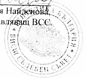
Соня Найденова, Представяващ ВСС.